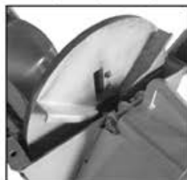
Scheibenrad mit Flügeln und Messer