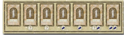
1 Kartenauslage (2 Puzzleteile)