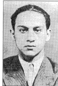
הרשל גרינשפאן נובמבר 1938

הרשל חתם על הגלויה בצורה הגרמנית של שמו הפרטי.