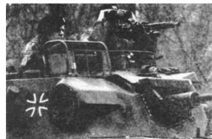
Deutsche Soldaten in Mazedonien.

Direkte Beteiligung der Bundeswehr mit eigenen Truppen an der Bombardierung: Am 24. März 1999 beginnen der deutsche Imperialismus und andere Imperialisten mit Luftangriffen auf Jugoslawien. Ziele des deutschen Imperialismus sind u. a. die Ausweitung seiner Großmachtinteressen, der Ausbau seiner Vormachtstellung in Ost- und Südosteuropa in Rivalität zu den übrigen Großmächten. Seit dem Ende des Krieges hält der deutsche Imperialismus einen Teil Kosovos besetzt.