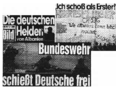
Im unteren Ausschnitt lügt „Bild“: „deutsche Soldaten schießen in Selbstverteidigung zurück“