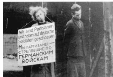
Am 26. Oktober 1941 ermordeten die Nazis eine Gruppe von Partisaninnen und Partisanen. Darunter die jüdische Partisanin Masha Brushkina.