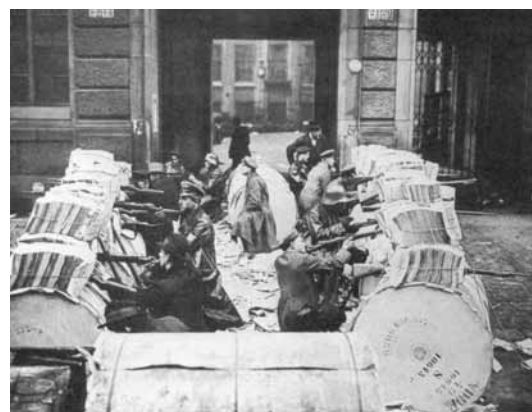
11. Januar 1919: Bewaffnete Arbeiter und Soldaten hinter Barrikaden aus Zeitungspapierrollen in Berlin.

• Mit bestialischer Gewalt ließ die konterrevolutionäre SPD-Führung zusammen mit der „Obersten Heeresleitung“ der Armee im Auftrag des deutschen Imperialismus die kämpfenden Arbeiterinnen und Arbeiter im Januar 1919 misshandeln, foltern und niedermetzeln, ihre entschlossensten Vorkämpfer, Rosa Luxemburg und Karl Liebknecht, ermorden. Bis zur Niederschlagung der Münchner Räterepublik im Mai 1919 wurden über 30.000 revolutionäre Arbeiterinnen und Arbeiter ermordet.