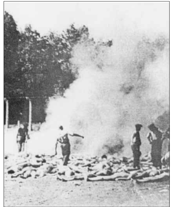
Eines der drei Fotos eines Mitglieds der Kampfgruppe Auschwitz, die aus dem Vernichtungslager Auschwitz-Birkenau herausgeschmuggelt werden konnten und Verbrechen der Nazis dokumentieren. Die Leichen wurden im Freien verbrannt, als die Krematorien nicht mehr ausreichten.

„Nicht nur Hitler ist schuld an den Verbrechen, die an der Menschheit begangen wurden! Ihr Teil Schuld tragen auch die zehn Millionen Deutschen, die 1932 bei freien Wahlen für Hitler stimmten, ... Schuld tragen alle jene Deutschen die in der Aufrüstung die 'Größe Deutschlands' sahen und im wilden Militarismus, im Marschieren und Exerzieren das allein seligmachende Heil der Nation erblickten.“ (Aufruf des ZK der KPD vom 11. Juni 1945)