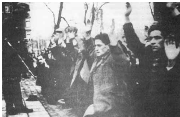
25. Februar 1941 in Amsterdam: Razzia gegen streikende Arbeiterinnen und Arbeiter.

• In Frankreich wurden insgesamt ca. 80.000 Juden und Jüdinnen durch die Nazis ermordet. 4,5 Millionen Einwohner Frankreichs wurden nach Nazi-Deutschland zur Zwangsarbeit verschleppt. 20.000 Kämpferinnen und Kämpfer der Résistance wurden von den Nazis ermordet, über 60.000 in Nazi-KZs deportiert. Ganze Dörfer wurden zerstört und ihre Einwohner – vom Kleinkind bis zum Greis – bestialisch ermordet, wie z. B. beim SS-Massaker von Oradour am 10. Juni 1944. 70.000 Einwohner wurden durch Geislerschießungen ermordet. Insgesamt wurden über 650.000 von den Nazis ermordet.