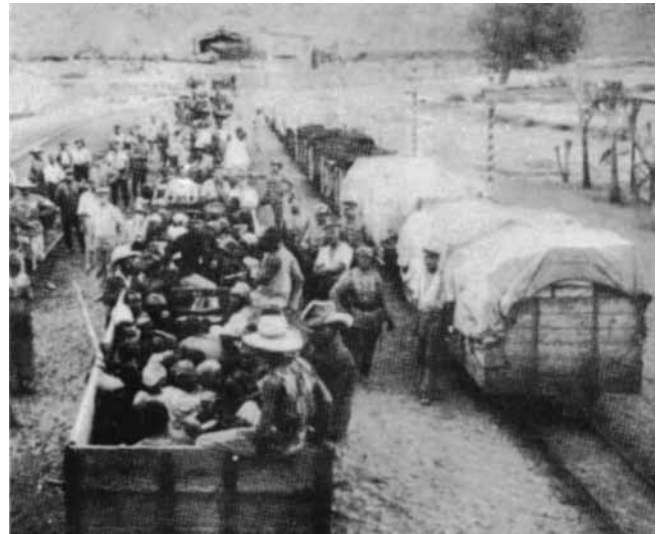
Eisenbahn-Transport gefangener Herero. Ein Teil der Überlebenden wurde in deutschen Gefangenenlagern zusammengepfercht und starb dort an Hunger und Krankheiten.

• Die Herero und Nama ließen sich nicht wehrlos massakrieren, sondern leisteten über drei Jahre hinweg Widerstand. Mit einem Guerillakrieg konnten die aufständischen Herero und Nama den deutschen Truppen zeitweise empfindliche Schläge versetzen.