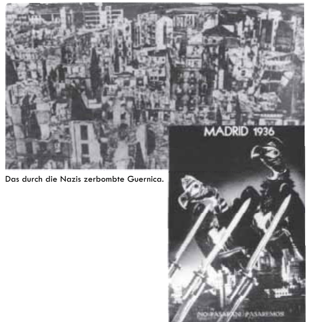
Das durch die Nazis zerbombte Guernica.

„Der spanische Bürgerkrieg war eine gute Gelegenheit, meine junge Luftwaffe auf die Probe zu stellen, damit meine Leute dort Erfahrungen sammeln.“ (Erklärung Görings im Nürnberger Prozess 1946)