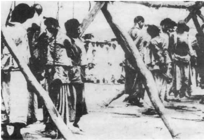
Hinrichtung von Befreiungskämpfern in Tianjin am 14. Juli 1900