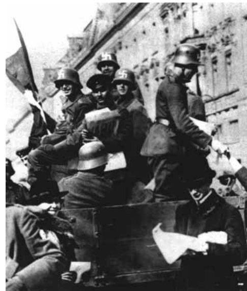
Konterrevolutionäre Kapp-Truppen mit Hakenkreuzen auf den Helmen im März 1920 in Essen.

Mitte der 20er Jahre forcierte der deutsche Imperialismus die Kriegsvorbereitung. Ein wichtiger Bestandteil war dabei der Bau von Panzerkreuzern zur Schaffung einer Kriegsflotte für den Zweiten Weltkrieg. Zielstrebig verfolgte er seit 1929 die Umsetzung seiner Kriegsprojekte durch einen auf fünf Jahre angelegten Plan für den erneuten Anlauf zur Erringung der Weltherrschaft.