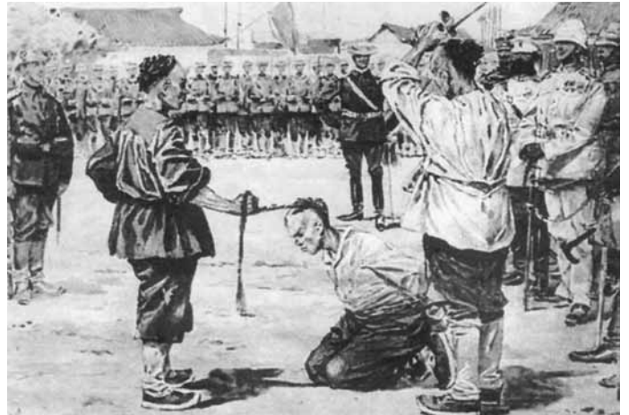
Hinrichtung des Revolutionärs En Hai, der den konterrevolutionären Gesandten von Ketteler erschoss

„Peking muss regelrecht angegriffen und dem Erdboden gleichgemacht werden... Peking muss rasiert werden... Es ist der Kampf Asiens gegen das ganze Europa.“