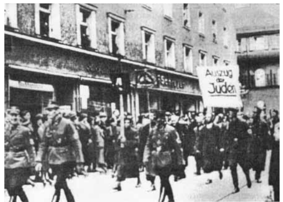
Deutsche Bevölkerung in den Straßen von Regensburg beobachtet die Deportation jüdischer Männer ins KZ Dachau, 10.11.1938.