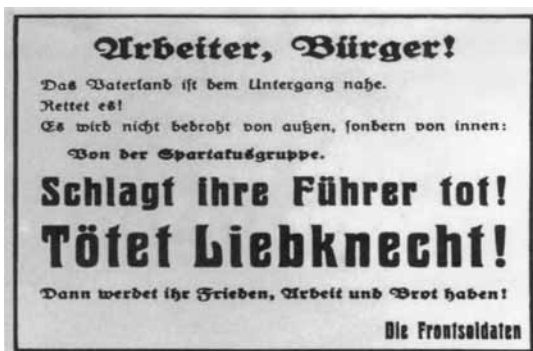
Öffentliche Mordhetze der von der konterrevolutionären SPD-Regierung befehligten Regierungstruppen, zu Hunderttausenden Anfang Januar 1919 auf Flugzetteln und Plakaten in den Straßen Berlins verbreitet.