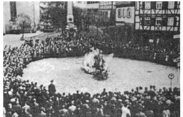
Die Bevölkerung von Mosbach bei der Verbrennung der Einrichtung und der religiösen Gegenstände der Synagoge am 10.11.1938.

(Aussage eines am 10.11.1938 ins Dresdner Polizeigefängnis verschleppten jüdischen Einwohners Bautzens)